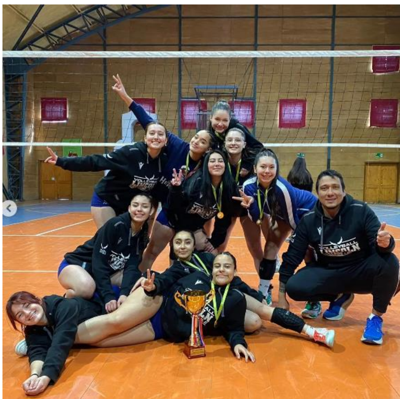
2do Lugar Campeonato en Chiloé

Voleibol Media logró el 2do Lugar en Campeonato Nacional realizado en la ciudad de Chiloé.