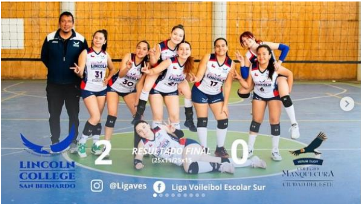
Nuevo Triunfo en Casa por la LIGAVES 2023 – Voleibol Damas